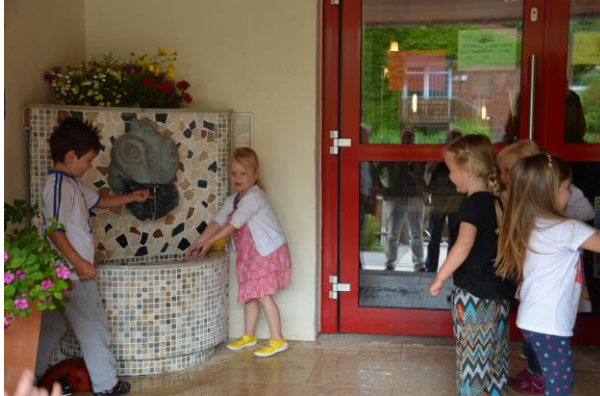
Bild 1: Die Kinder vom Kindergarten Sternschnuppe probieren ihren neuen Brunnen aus: Funktioniert prima und sieht richtig schick aus!